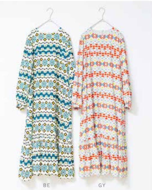
3S-D41 BE,GY ワンピース キカガク 入荷済み ¥12,000(税込¥13,200) レーヨン100%/裏地:コットン100% 着丈:119.5cm、肩巾:35cm、バスト:101.2cm 裾周り:141.6/240.5cm、袖丈:60.5cm 袖巾:40.7cm、袖口巾:21cm、天巾:17.1cm ポケット有

カラフルな色彩で描かれた幾何学模様が視覚的に楽しいテキスタイル。 しなやかな質感と落ち感が魅力のレーヨン素材です。