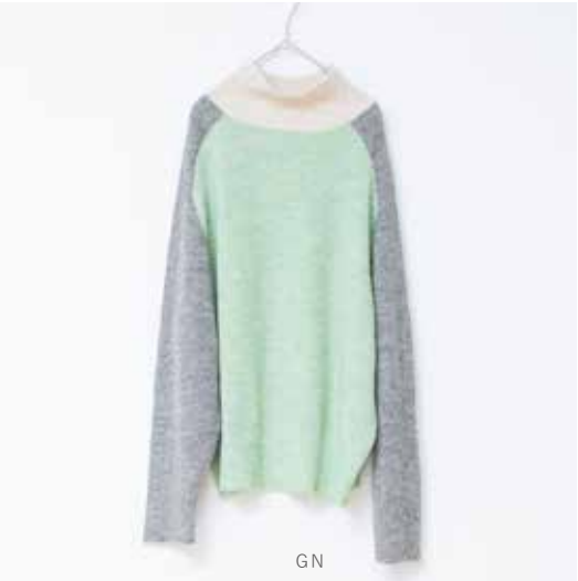
3H-B44 GN,NV プルオーバー ミックスカラー 9月入荷 ¥13,000(税込¥14,300) アクリル58%、ポリエステル30%、ウール12% 着丈：60cm、肩巾：46cm、バスト：118cm 裾周り：94cm、袖丈：54cm、A/H：24cm 袖巾：21cm、袖口巾：12cm、天巾：17cm