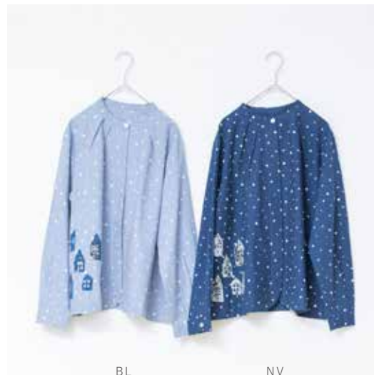
3S-B45 BL,NV ブラウス ハウス