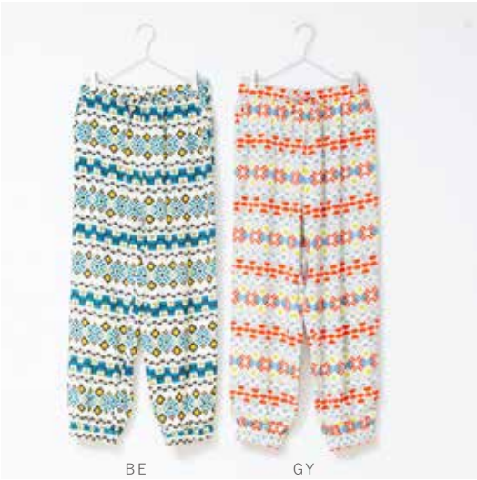
3S-P41 BE,GY パンツ キカガク 入荷済み ¥10,000(税込¥11,000) レーヨン100%/裏地:コットン100% 着丈:98cm、ウエスト:70cm~99cm ヒップ:105.4cm、裾巾:27/44cm ワタリ巾:35cm、股上:29cm、股下:65cm ポケット有