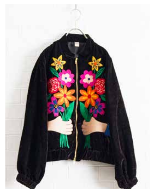
4G-B44 ブルゾン セレブレーション 10月入荷 ¥22,000(税込¥24,200) ポリエステル100%(ベルベット) 裏地:ポリエステル100% 着丈:58cm、肩巾:41cm、バスト:118cm 裾巾:104cm、袖丈:60cm、袖巾:22cm 袖口巾:11cm、天巾:15cm ポケット有

ベルベット素材の「CELEBRATION」シリーズは、花束を手渡す刺繍が印象的です。ブルゾンとベストにはダブルジップが採用されており、多彩な着こなしが楽しめます。華やかでありながら、どこか温かみのあるデザインが魅力です。