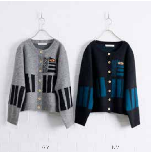
4H-B44 GY,NV カーディガン シマウマ 10月入荷 ¥16,000(税込¥17,600) アクリル58%、テニセル30%、ウール12% 着丈:57cm、肩巾:42cm、バスト:114cm 袖丈:55cm、A/H:24cm、袖巾:20cm、袖口巾:11cm 天巾:19cm ポケット有