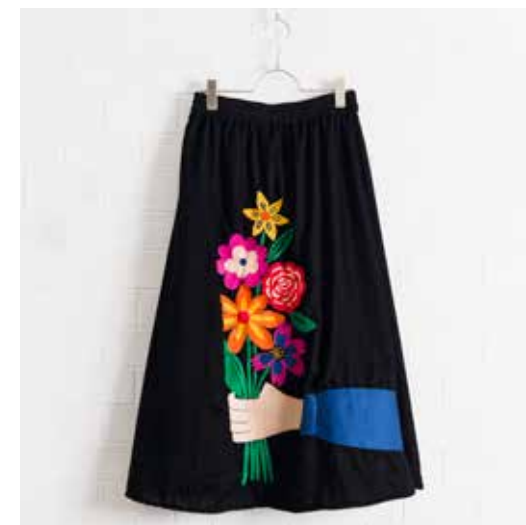
4G-S44 スカート セレブレーション 10月入荷 ¥18,000(税込¥19,800) ポリエステル100%(ベルベット) 裏地:ポリエステル100% 着丈:80cm、ウエスト:68cm〜98cm ヒップ:130cm、裾周り:184cm