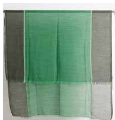
4A-A42 BL,GN ラインステッチ ウールショール 8月入荷 ¥7,900(税込¥8,690) ウール52%、コットン46%、アクリル2% 100cmx180cm