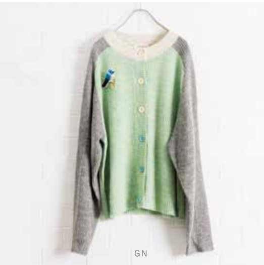
3H-B43 GN,NV カーディガン ミックスカラー 9月入荷 ¥13,000(税込¥14,300) アクリル58%、ポリエステル30%、ウール12% 着丈：58cm、肩巾：40cm、バスト：112cm 裾周り：96cm、袖丈：58cm、A/H：24cm 袖巾：22cm、袖口巾：11cm、天巾：17cm

Model：Phoebe(162cm) Hairstylist：Mie Hirabayashi