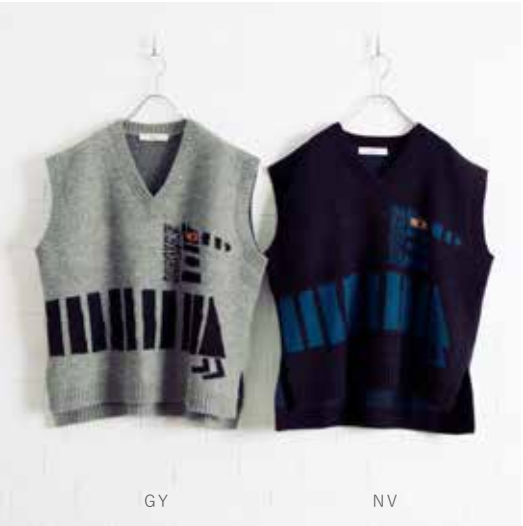
4H-B43 GY,NV ベスト シマウマ 10月入荷 ¥13,000(税込¥14,300) アクリル58%、テニセル30%、ウール12% 着丈:前/63cm、後/67cm、肩巾:52cm バスト:124cm、裾巾:122cm、A/H:25cm 天巾:16cm

シマウマ柄のニットは、モダンなデザインと温かみのある風合いが特徴です。 カーディガンには存在感のあるボタンを採用しました。 暖かく快適な着心地で、デイリーに活躍します。