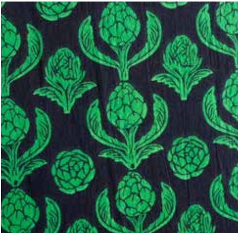
アーティチョーク

上品な緑と紫の色合いが特徴。優雅なモチーフが洗練された印象を与え、日常のアイテムにも特別感をプラスします。 キャッツ柄とミックスして、より一層個性的なファッションを楽しんでください。