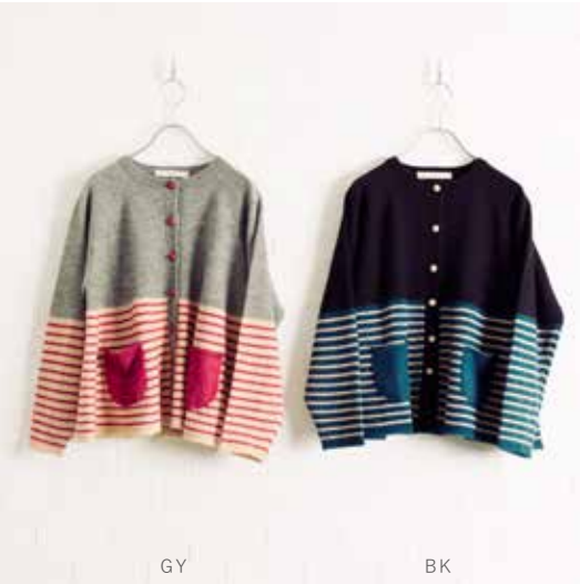
4H-B42 BK,GY カーディガン フレアボーダー 10月入荷 ¥14,000(税込¥15,400) アクリル58%、テニセル30%、ウール12% 着丈:56.5cm、バスト:102cm、裾巾:152cm 衿丈:70cm、袖口巾:10cm、天巾:13cm ポケット有