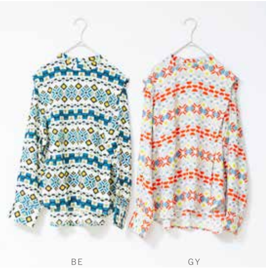
3S-B41 BE,GY ブラウス キカガク 入荷済み ¥7,800(税込¥8,580) レーヨン100% 着丈:63cm、肩巾:34/42cm、バスト:95cm 裾周り:123.5cm、袖丈:61cm、衿丈:78cm 袖巾:45.7cm、袖口巾:23cm、天巾:17.4cm