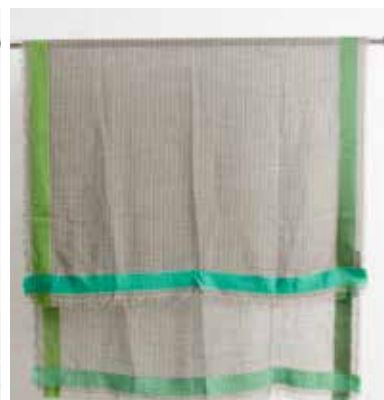
4A-A41 BE,GN チェッカー ウールショール 8月入荷 ¥7,900(税込¥8,690) ウール55%、コットン25%、アクリル20% 100cmx180cm