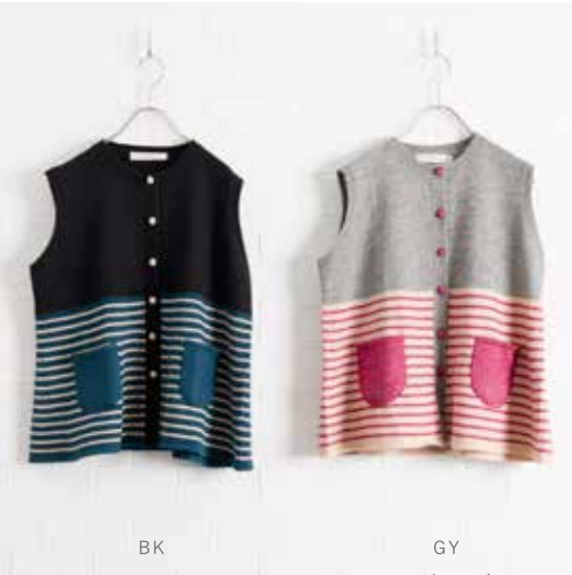
4H-B41 BK,GY ベスト フレアボーダー 10月入荷 ¥12,000(税込¥13,200) アクリル58%、テニセル30%、ウール12% 着丈:58cm、肩巾:36cm、バスト:100cm 裾巾:141cm、天巾:13cm ポケット有

柔らかな素材感と女性らしいシルエットが魅力の「フレアボーダー」シリーズは、クラシカルなボーダーデザインが特徴です。 ボタンとポケットの配色がスタイルに個性をプラスしています。