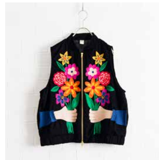
4G-B45 ベスト セレブレーション 10月入荷 ¥18,000(税込¥19,800) ポリエステル100%(ベルベット) 裏地:ポリエステル100% 着丈:58cm、肩巾:38cm、バスト:114cm 裾巾:103cm、A/H:27cm、天巾:16cm ポケット有