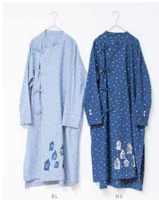
3S-D45 BL,NV ワンピース ハウス

白い雪と家のシルエットが浮かぶこのテキスタイルは、夜の静けさと家の温もりを感じさせます。幻想的なタッチで描かれた家々が、絵本のようにでなほっこりとした雰囲気を出します。