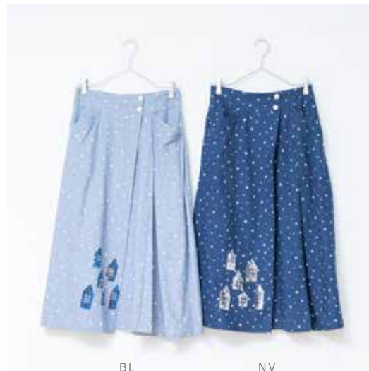
3S-S45 BL,NV スカート ハウス