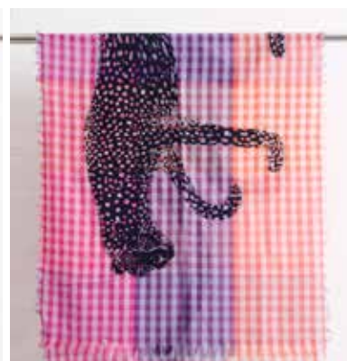
4A-A43 GN,PU レオパード ウールショール 8月入荷 ¥9,900(税込¥10,890) ウール40%、コットン40%、アクリル20% 70cmx180cm